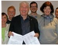
Kulturladen Benthe: Eröffnung rückt immer näher