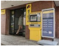
Postfiliale in Gehrden schließt Ende April