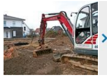
Baugebiet Langes Feld: Erschließung beginnt