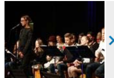
KGS-Schüler geben ihr großes Winterkonzert