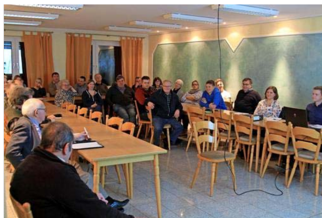
40 Menschen hören im Feuerwehrhaus zu.

Hauptschulzweigleiter Deseniß wird verabschiedet