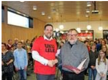
Hauptschulzweigleiter Deseniß wird verabschiedet