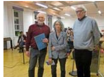
Holocaustgedenken in Barsinghausen