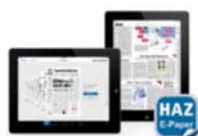
Die HAZ E-Paper App