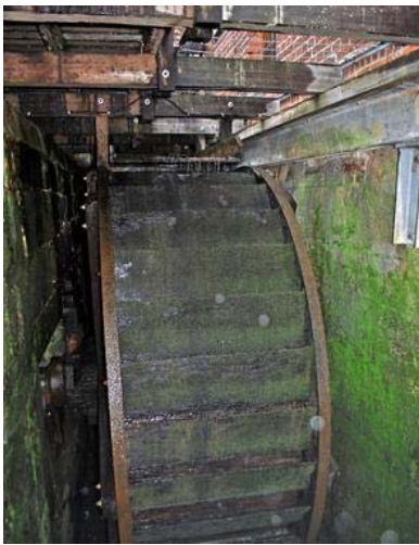
Das Mühlrad am Heimatmuseum bleibt stehen, wenn das Wasser ausbleibt.