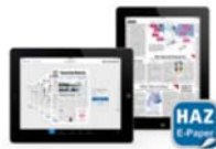
Die HAZ E-Paper App