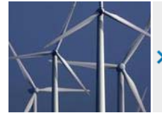
Auch die Märker wollen gegen den Windpark kämpfen