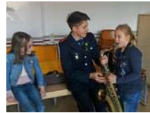
Feuerwehrmusikzug begeistert Kinder fürs Musizieren