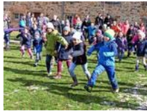
Kirchentage sorgen wieder für Ansturm